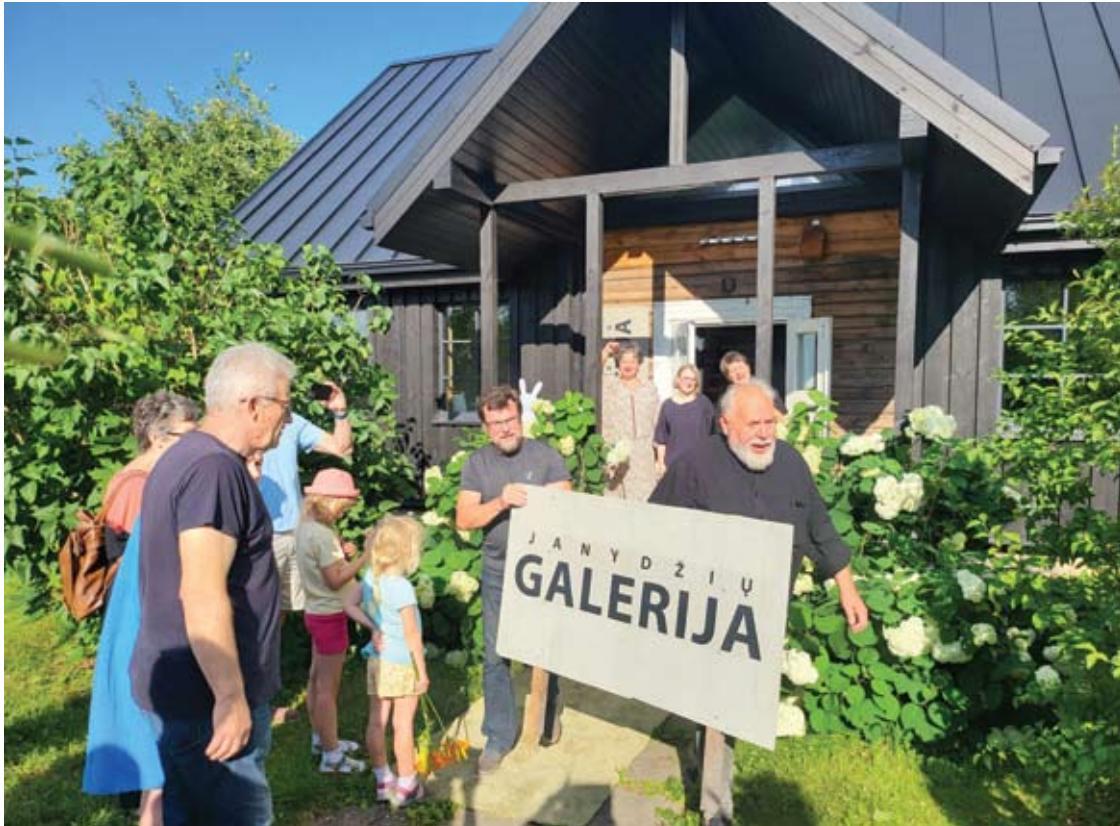
Galerijos atidaryme dalyvavo anykštėnai dailininkai, kaimynai iš gretimų namų.

Vasarą galerija veiks penktadieniais - sekmadieniais. Tomis dienomis joje bus galima susitikti su pačiomis menininkėmis, dalyvauti jų rengiamose vasaros laboratorijose. Tačiau tie, kurie norėtų patekti kitu laiku, dėl apsilankymo turės susitarti iš anksto.