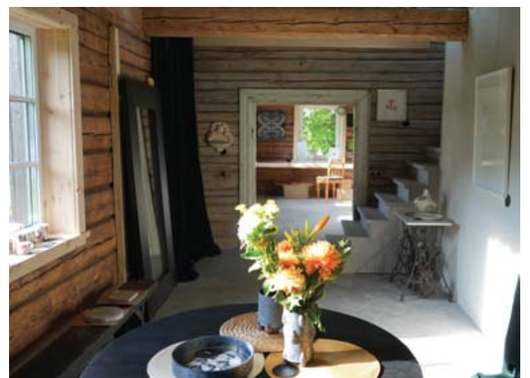
„Janydžių galerija“ veikia penktadieniais, šeštadieniais ir sekmadieniais.