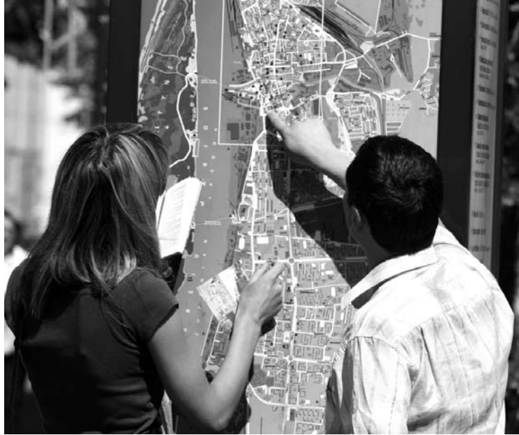
Anykščių rajono savivaldybė pirmiausia išsiaiškino, kam siųsti kvietimą dalyvauti viešajame pirkime.

Žinia, kad už ne mažiau kaip 25 šeimų pritraukimą pernakvoti savivaldybė pasiruošusi sumokėti net iki 10 tūkst. eurų, nustebino visuomenės atstovus, o Anykščių turizmo ir verslo informacijos centrui (TVIC), kurio tiesioginė funkcija yra pritraukti turistus, užminė mįslę, kodėl savivaldybė šio darbo nepatikėjo jam.