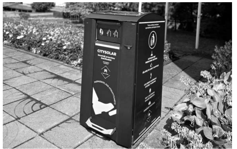
Tokia išmanioji šiukšlių dėžė, kuri pati, naudodama saulės energiją, supresuoja šiukšles, kol kas stovės prie Anykščių rajono savivaldybės pastato. Vėliau ji bus perkelta ten, kur vyks didesni žmonių susibūrimai.